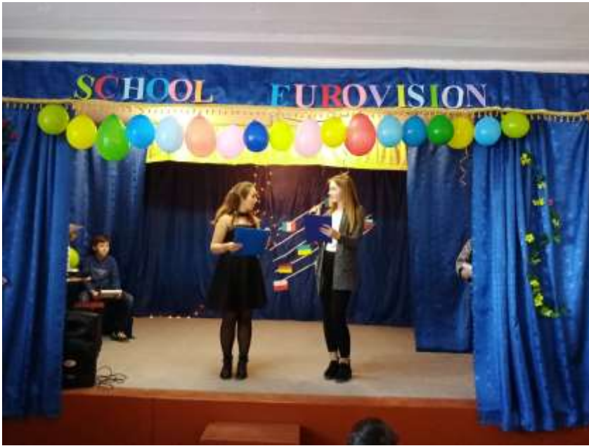
Лютий Шкільне Євробачення