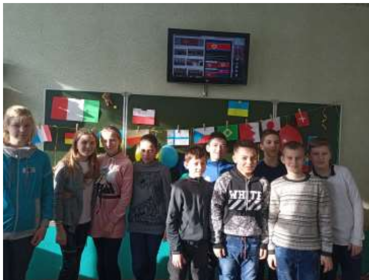
Січень Вікторина «Країни і національності»