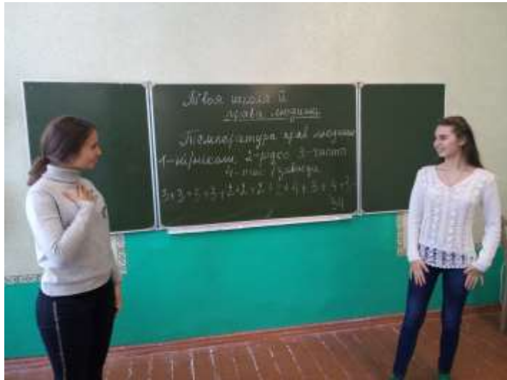
Грудень Заняття-тренінг «Твоя школа й права людини»