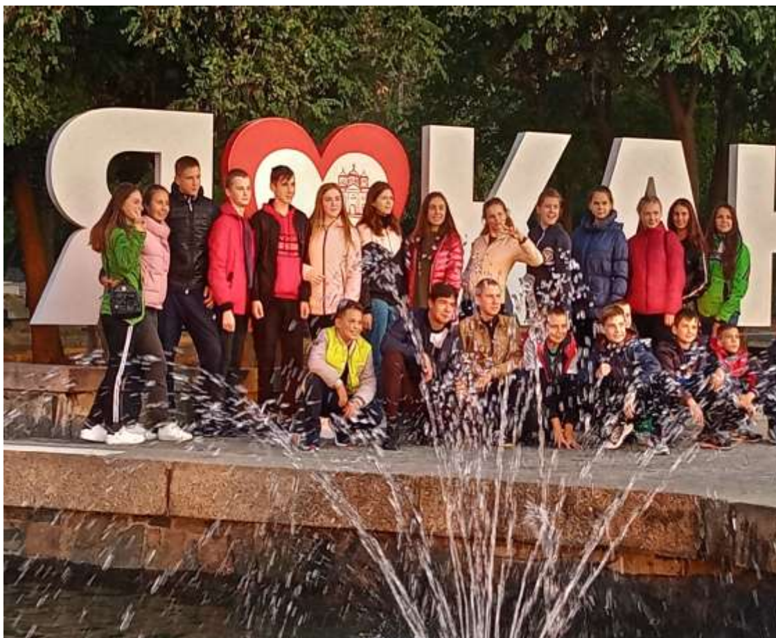
Екскурсія до Канева та Умані