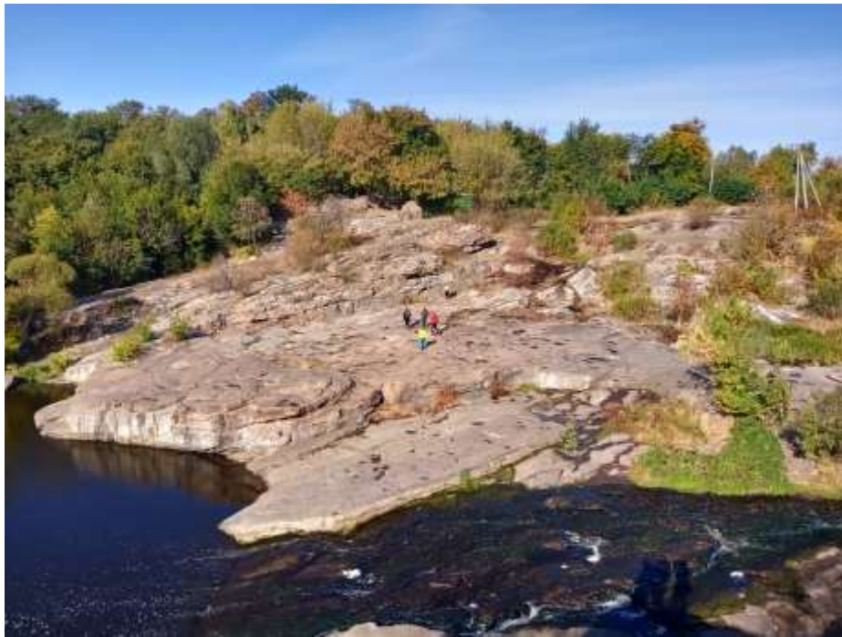
По дорозі з Умані додому ми заїхали на Букський каньон, який знаходиться в с.Буки Черкаської області і вважається природним чудом України