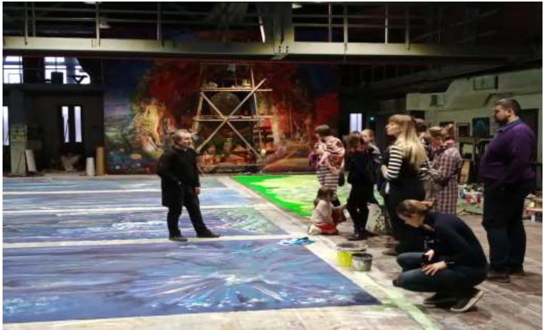
Екскурсія за лаштунки Оперного театру