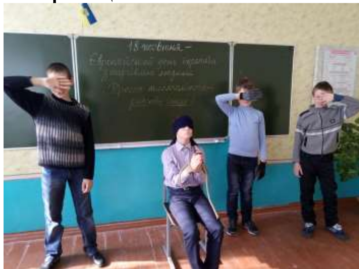
Жовтень Європейський день боротьби з торгівлею людьми Заняття-тренінг «Третє тисячоліття – рабство існує!»