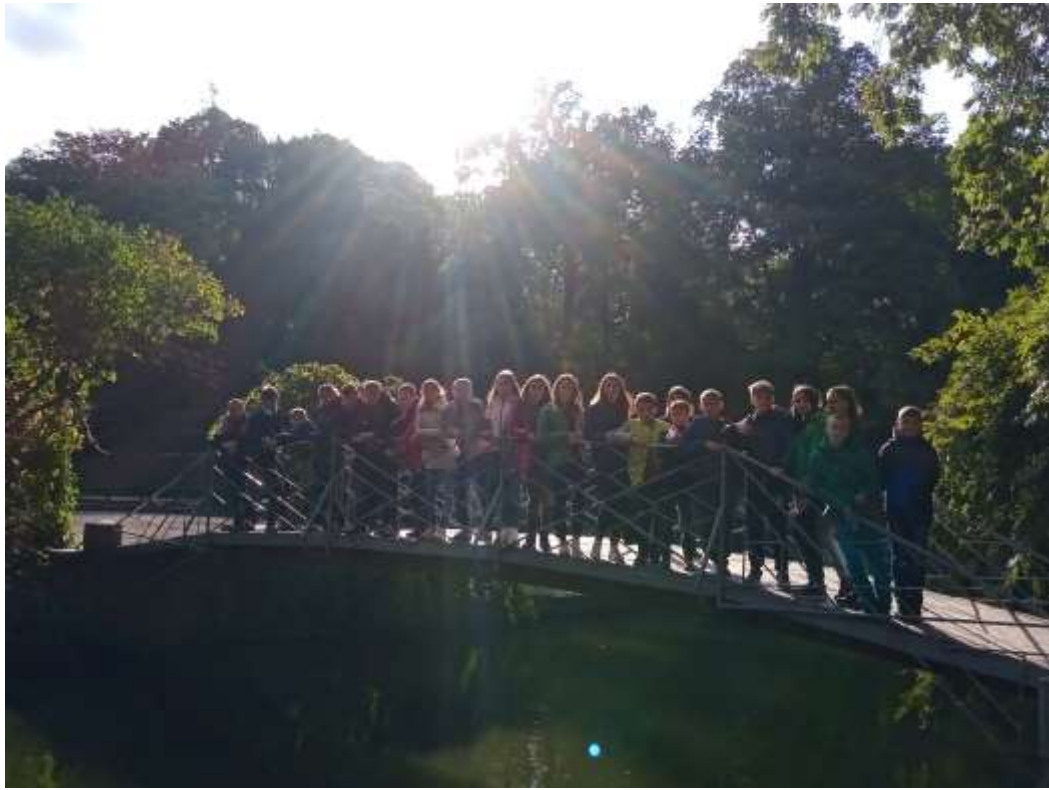
Експедиція до парку «Софіївка» в Умані