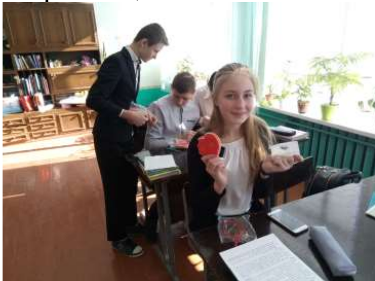
Лютий День Святого Валентина у Євроклубі