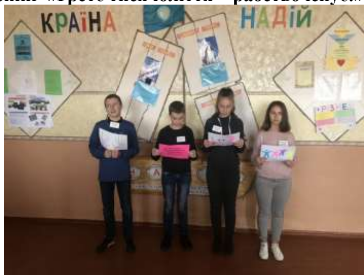
Листопад День толерантності