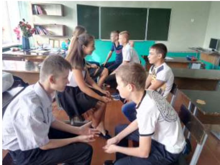
Вересень Дискусія «Ми – європейці?»