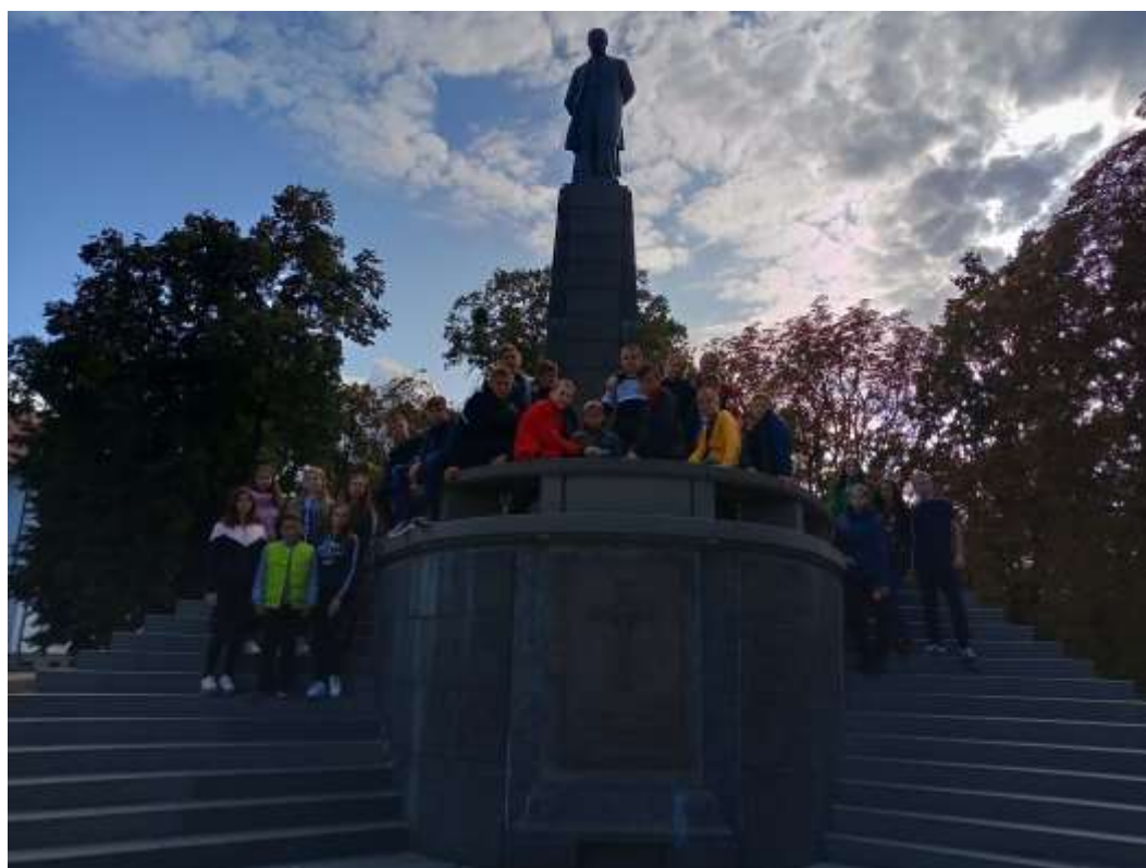
Біля пам'ятника Т.Г. Шевченку на Чернечій горі