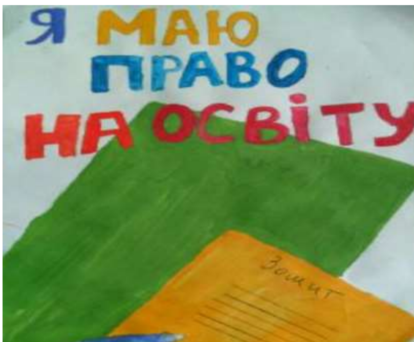
Робота Усенко Віталія, учня 9 класу